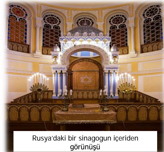
Rusya'daki bir sinagogun içeriden görünüşü