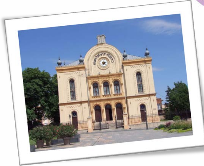
Macaristan'da bulunan bir sinagog