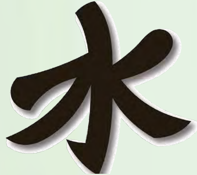
Konfüçyanizm 'in Sembolü