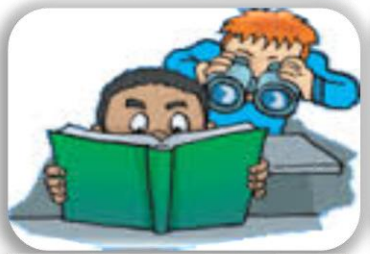
Kopya Çekmek Vermek