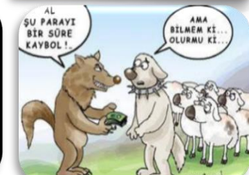
Rüşvet Almak Vermek