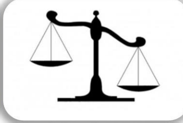
Hile Yapmak Aldatmak