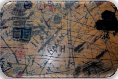
Sıralara Yazı Yazmak