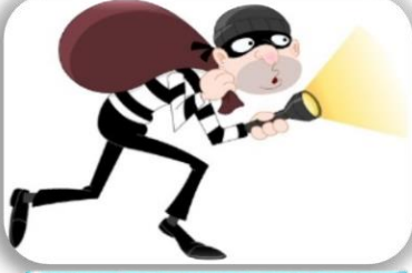
Hırsızlık Vergi Kaçırma