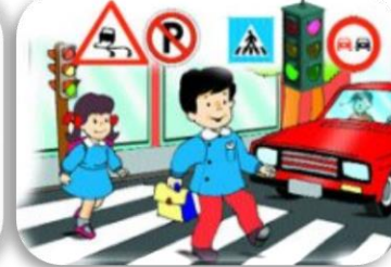
Trafik Kurallarına Uymamak