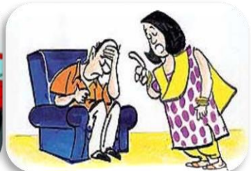
Anne Babaya Kötü Davranmak