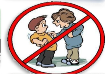
Lakap Takmak Alay Etmek