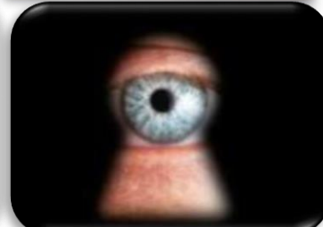
Özel Halleri Araştırmak