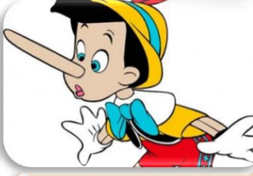
Yalan Söyleme - İftira