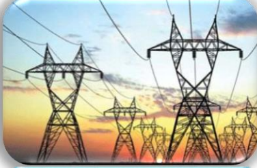
Kaçak Su Kaçak Elektrik